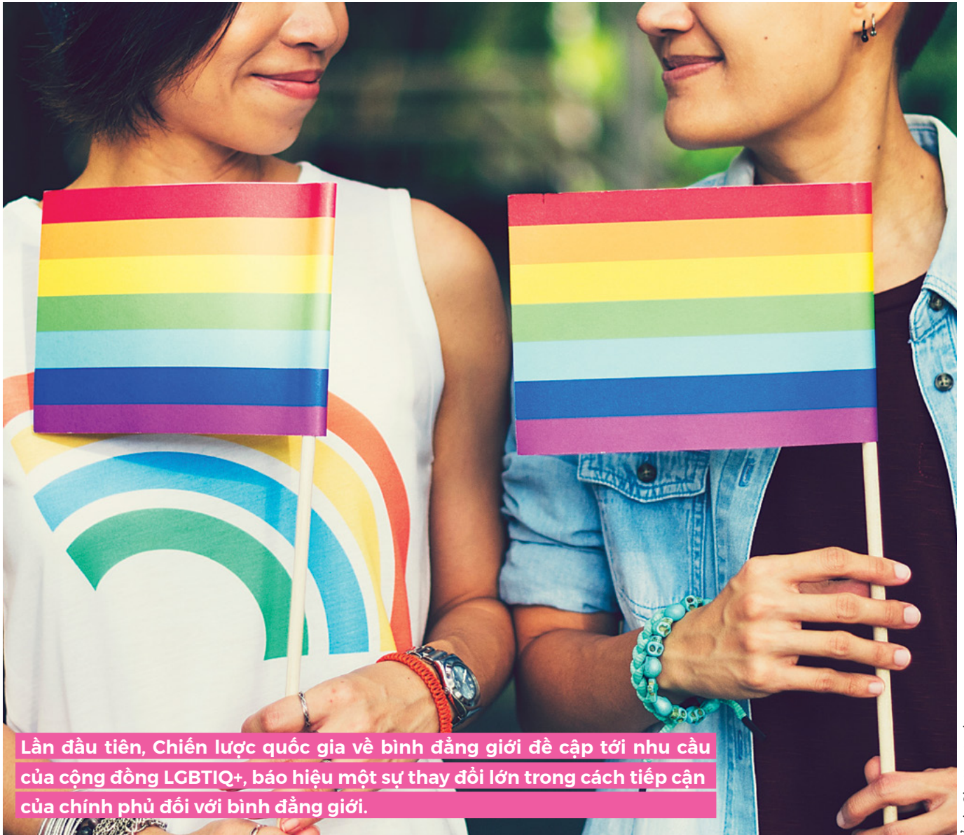
Lần đầu tiên, Chiến lược quốc gia về bình đẳng giới đề cập tới nhu cầu của cộng đồng LGBTQ+, báo hiệu một sự thay đổi lớn trong cách tiếp cận của chính phủ đối với bình đẳng giới.

Kết quả là một chiến lược ưu tiên tăng cường ứng phó với bạo lực trên cơ sở giới, nâng cao vai trò lãnh đạo của phụ nữ trong chính phủ và khả năng tiếp cận tốt hơn với giáo dục sau đại học cho phụ nữ. Lần đầu tiên, CLQG về bình đẳng giới đề cập tới nhu cầu của cộng đồng LGBTQ+, báo hiệu một sự thay đổi lớn trong cách tiếp cận của chính phủ đối với bình đẳng giới.