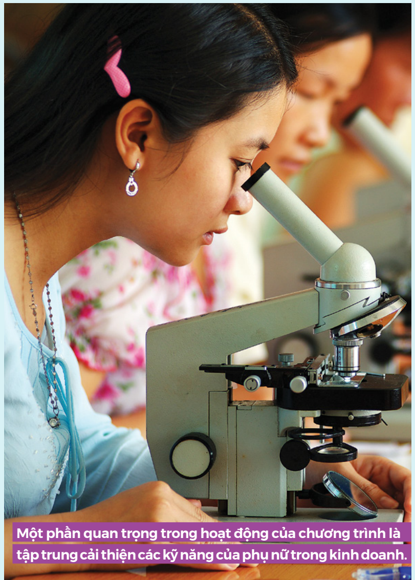
Một phần quan trọng trong hoạt động của chương trình là tập trung cải thiện các kỹ năng của phụ nữ trong kinh doanh.

Năm 2021, hơn 1,550 học viên đã học về kỹ năng kinh doanh trên các nền tảng học tập điện tử.