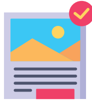
TRANH KÈM CỐT TRUYỆN