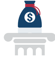
NGÂN SÁCH CHUNG