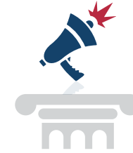
TIẾNG NÓI CHUNG